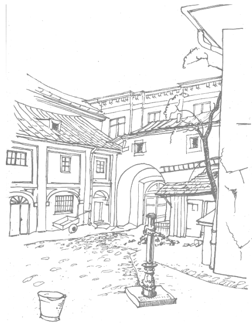
70. Ul. Poselaka 7