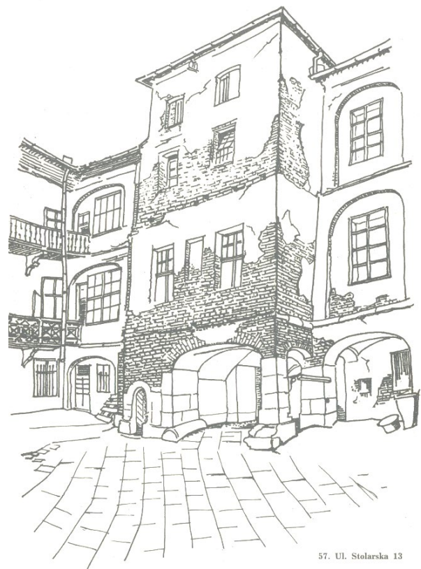
Рис. 2. Л. Гец. Ілюстрація до книги «Dawne dzielnice i podwórza Krakowa». 1950-ті рр. Туш, перо, папір