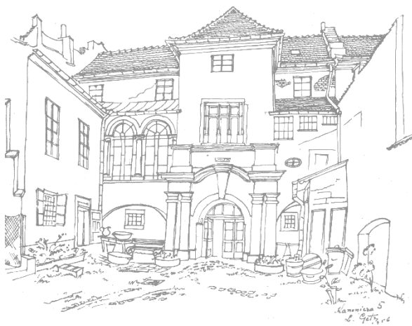
74. Ul. Kanonicza 5

Академічна освіта та роками відпрацьований професіоналізм художника-графіка виробили в Гецьові лаконічне, а часом – ощадливе застосування художніх засобів, що сприяло створенню підкреслено особистісно-емоційних рисунків. Мистець свідомо уникав показово-чуттєвих чи художніх перебільшень: його твори наповнені виваженістю, статичністю, шляхетною подачею, ґрунтованою на захопленні історичною величчю і красою архітектурних пам'яток давнього Кракова.