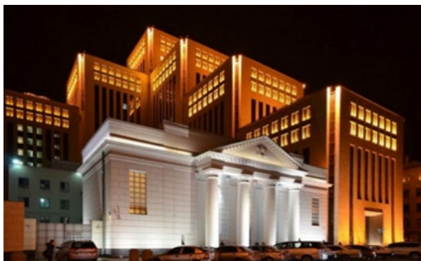
Рис. 5. «Menorah» (м. Дніпро, Україна, 2012) [34]