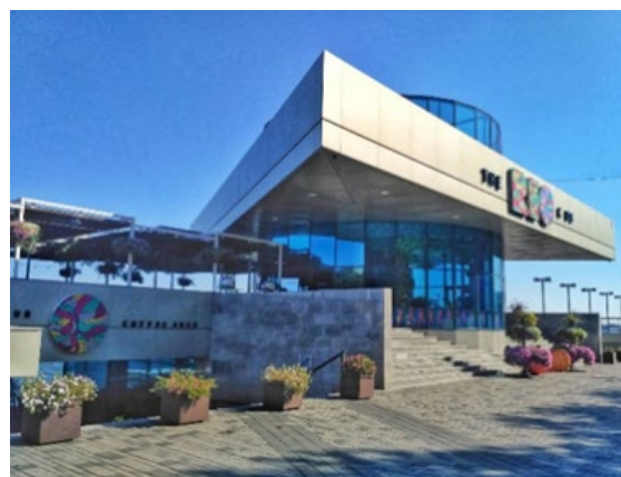
Рис. 10. «Rio Club» (м. Дніпро, Україна)