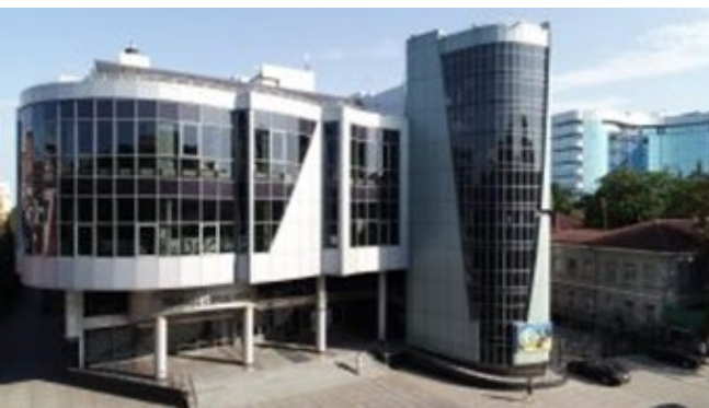
Рис. 6. Палац студентів НЮУ ім. Ярослава Мудрого (м. Харків, Україна, 2004)