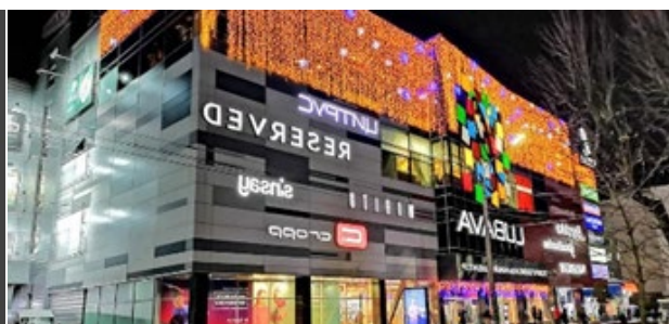
Рис. 8. «Lubava» (м. Черкаси, Україна, 2013)