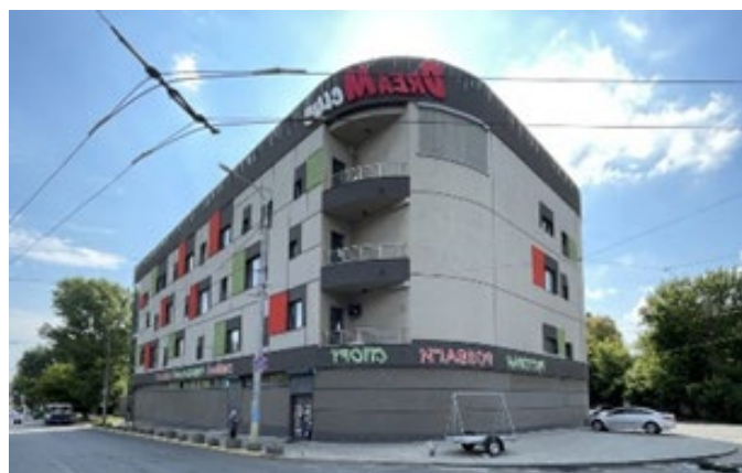
Рис. 9. «DreaM Club» (м. Дніпро, Україна, 2020)