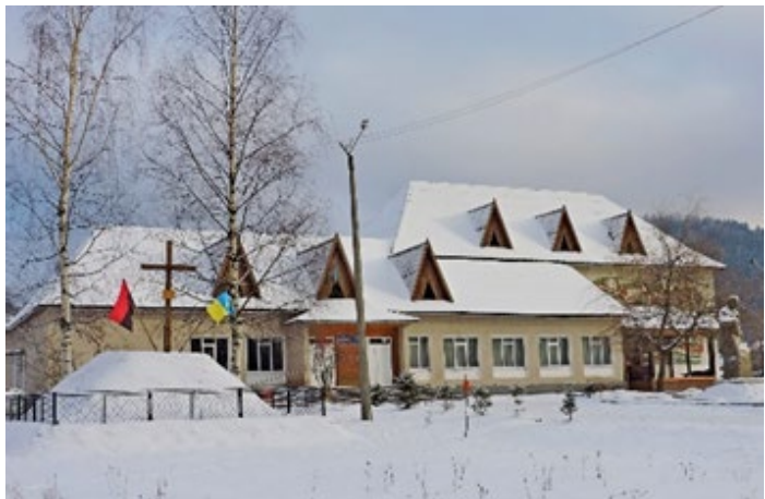
Рис. 2. Центр культури, дозвілля молоді та спорту (с. Татарів, Україна, 2014)