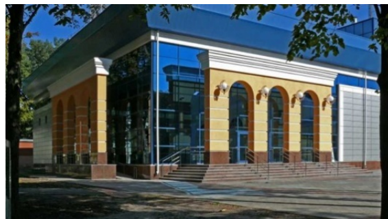
Рис. 4. Центр культури та дозвілля (м. Полтава, Україна, 2021)