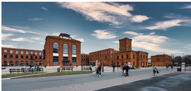
Рис. 3. «Manufaktura» (м. Лодзь, Польща, 2006) [39]