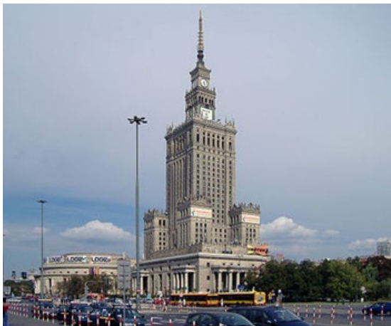
Рис. 1. Палац Культури та Науки (м. Варшава, Польща, 1955)

Центри дозвілля різного призначення, розташування та спрямованості можна класифікувати за розміром. Великі комплекси, такі як сімейний спортивно-відпочинковий центр «Leoland» у Львові мають понад п'ять основних зон. «Leoland» є результатом реконструкції спортивного комплексу «Україна» з елементами реновації та включає дитячий пізнавальний простір, футбольний клуб, фуд-хол, фітнес-клуб, тенісні корти, басейн, SPA-зону та багатофункціональний Івент-Хол, що використовується для проведення різноманітних заходів [23]. Середні центри дозвілля містять до 4 основних приміщень. На рис. 4 представлено приклад подібного закладу — Центр культури та дозвілля Полтавської міської територіальної громади, в якому створені всі необхідні умови для відпочинку і розваг. В складі центру: глядацька зала, велика та мала дискотечно-виставкові зали, простір Прес-центру для проведення конференцій і семінарів [33]. До 3 основних приміщень включають малі центри дозвілля, такі як Центр дозвілля для людей похилого віку, створений на базі Тростянецького територіального центру соціального обслуговування [32]