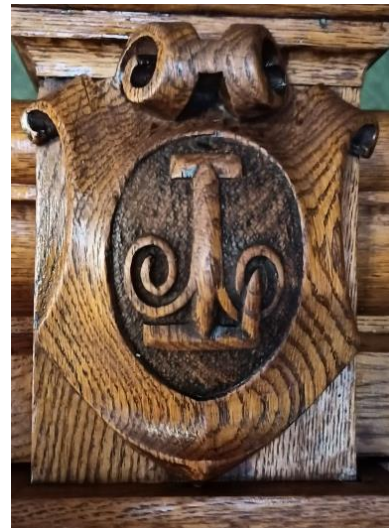
Рис. 2. Картуш з емблемою в центрі, з стовпця балюстради бібліотечної шафи головного корпусу НУЛП.