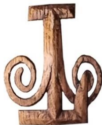
Рис. 3. Емблема на картуші та її збільшене зображення окремо від тла.