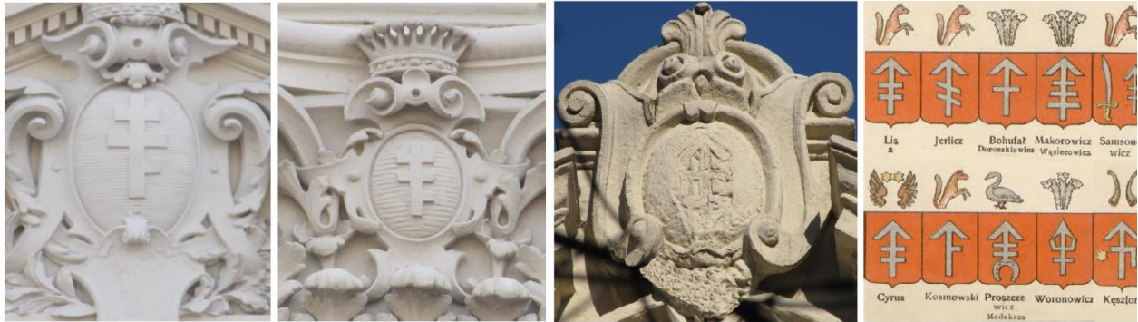
Рис. 8. Барельєфи гербів Пилява на Палаці Потоцьких, Львів – а), б); Барельєф гербу Лис на палаці Сапіг, Львів – в).