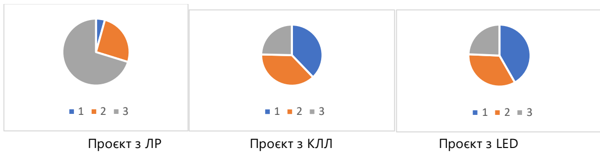
Рис. 1. Структура розподілу щорічних витрат за варіантами: 1 – вартість ламп; 2 – вартість електрообладнання; 3 – вартість спожитої електроенергії за рік.

наведено на рис. 2. формат книжкового знака.