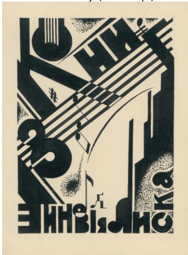
Рис. 3. Лев Гец. Екслібрис Зиновія Лиска. 1930-ті рр.