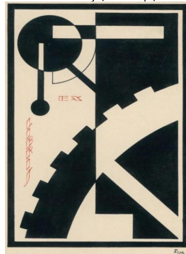
Рис. 4. Лев Гец. Екслібрис. 1930-ті рр.