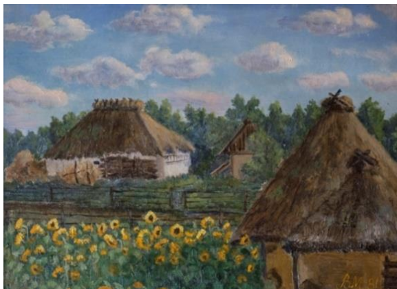
Рис. 3. «Подвір'я Тітоньки Улити», 30x40, 1981р.