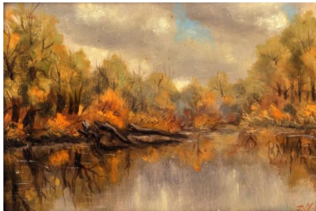
Рис. 2. «Осінній день», 25x35, 1990р.