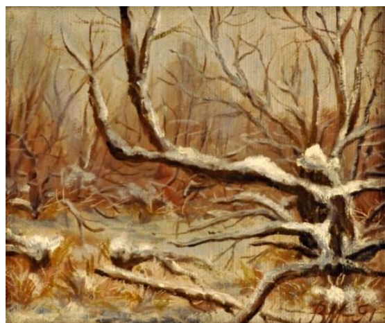
Рис. 5. «Засніжені старі верби», 20x25, 1991р.