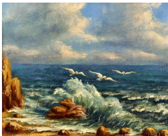
Рис. 6. «Морський пейзаж», 1994р.