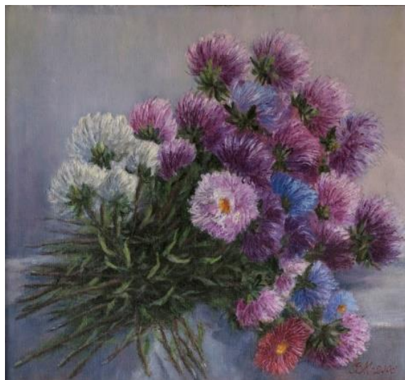
Рис. 10. «Айстри», 35x40, 2006р.