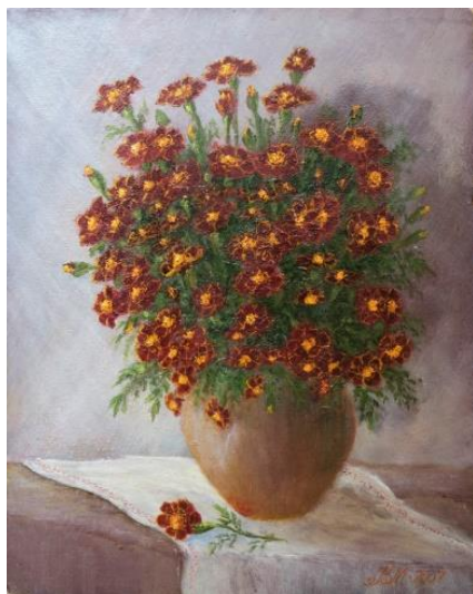
Рис. 9. «Чорнобривці», 50x40, 1984р.