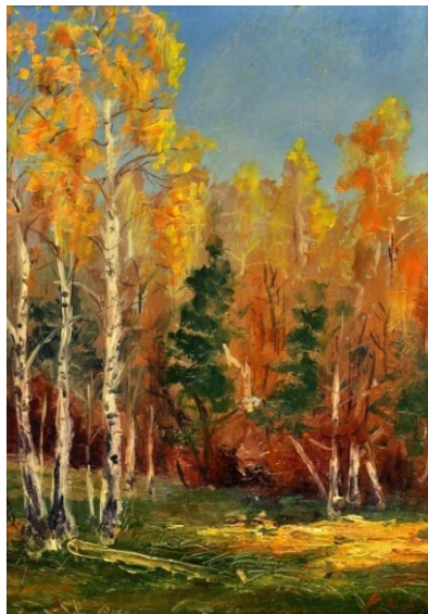
Рис. 1. «Корсунська осінь», 45x35, 1989р.