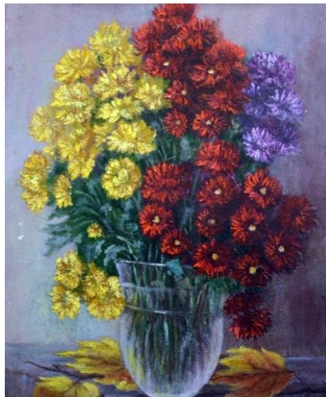
Рис. 8. «Диво пізньої осені», 59x40, 2005р.