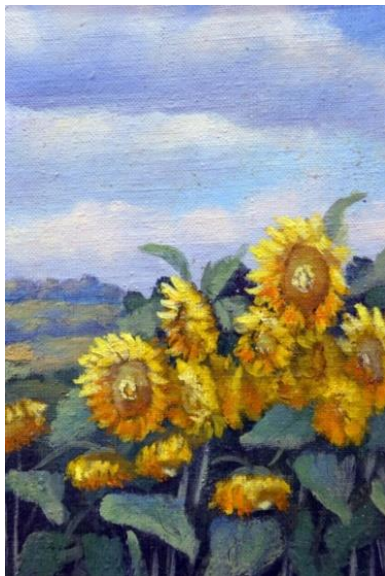
Рис. 7. «Соняшник», 50x40, 1983р.