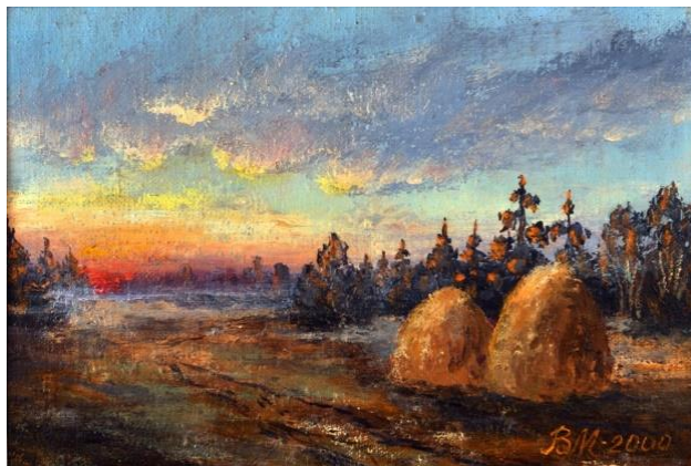
Рис. 4. «Вечір пізньої осені», 20x30, 2000р.