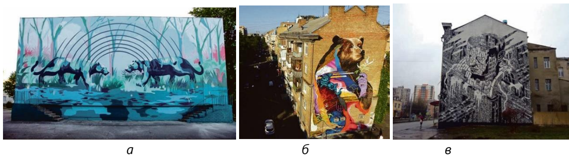
Рис. 11. Український стріт-арт, що увійшов до найкращих світових муралів 2017 р.