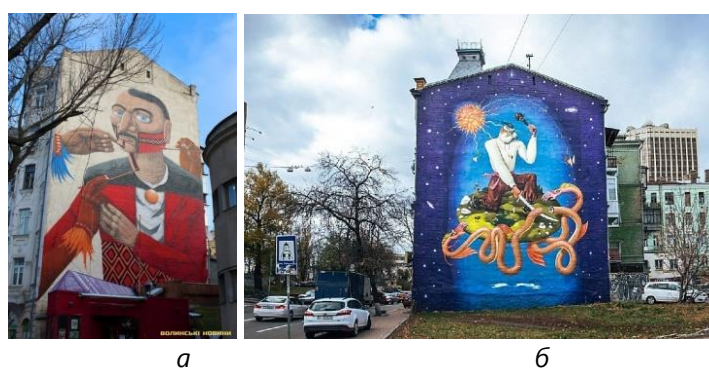
Рис. 10. а – мурал «Український козак», бразильський художник Ф. Родріго да Сільва, м. Київ, Поділ; б – мурал «Святий Георгій», О. Бордусов та В. Манжос, м. Київ, вул. Велика Житомирська