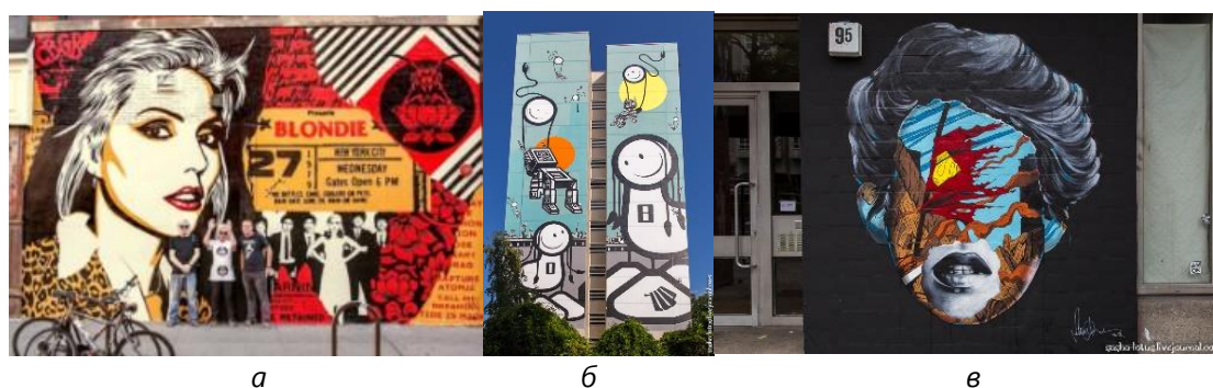
Рис. 5. Мурали в стилі американської поп-культури на вулицях США

У Південній та Латинській Америці у зв'язку із політичними умовами початку ХХ ст. мурал став своєрідним революційним рупором та формою протесту. З того часу пройшло ціле століття, й багато чого із мотивів минулого стало заборонено зображати у багатьох регіонах. Але людські настрої та поривання, які шукають свого вираження, та здатність художників відгукуватись на ці соціальні запити, які перетворюють їх на мистецтво, спроможні змінити багато правил, тому у багатьох містах тут шанується муралізм як явище, та навіть заохочується. Універсальний за своїм характером та унікальним за змістом, він поширюється по всьому континенту, створюючи єдину і глибоко особливу мистецьку сцену, тісно пов'язану з її культурою, традиціями, історією та людьми. У таких країнах, як Чилі, Бразилія, Аргентина, Нікарагуа, Венесуела, Болівія, Еквадор, Колумбія і Перу, цілі міста – це міські твори мистецтва (рис. 6) [3, 14]. На рисунку 6 (в, г, д, ж) представлено мурал Е. Кобри, на якому