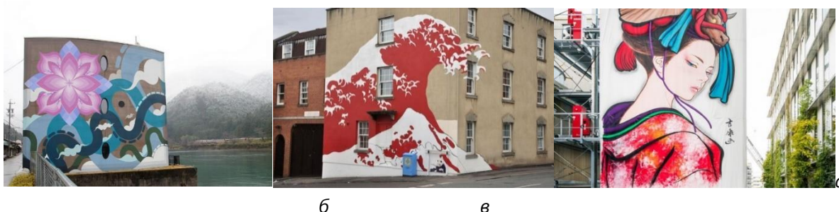
Рис. 7. Мурали Японії