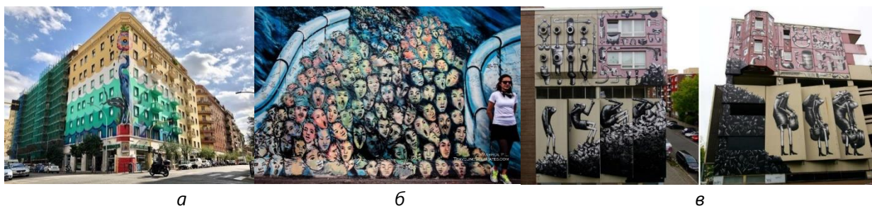
Рис. 4. а – екологічний мурал «Чапля» художника Федеріко Маса, Італія; б – мурал Берлінської стіни, що виражає ідею об'єднання Німеччини; в – мурал британського художника Phlegm, Берлін.