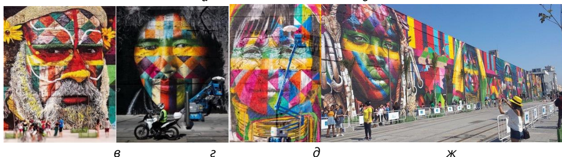
Рис. 6. а, б – революційні мурали, м. Сантьяго, Кокабамба; в, з, д, ж – мурал Е. Кобри