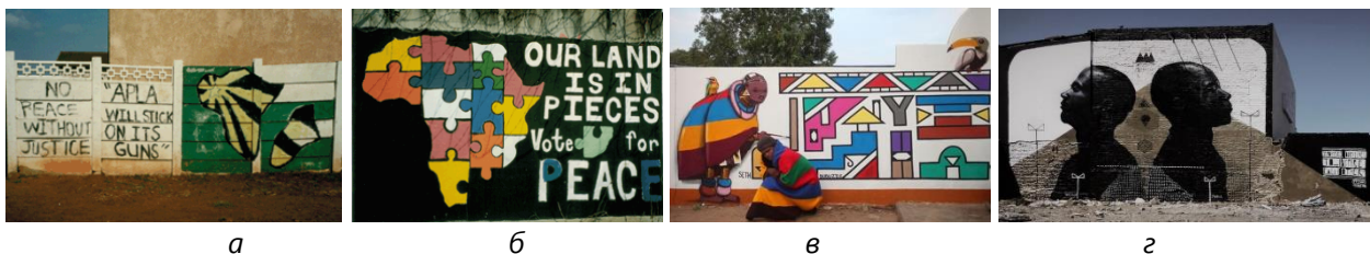
Рис. 9. а, б – соціально-політичні мурали Африки; в, з – мурали Африки як синтез африканської культури та західних тенденцій

тільки завдяки своїй високій естетичності, а й тому, що сприяє соціо-культурній самоідентифікації громадян.