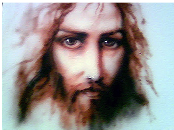
Рис. 12. Творча робота А.Г. Шаповала за напрямом – аерографія, «Погляд», сепія, 2007 р.

Висновки. Художні твори А.Г. Шаповала винятково реалістичні, а в окремих випадках глибоко драматичні, в яких лише правда життя, що відображена і зафіксована вдумливим художником-