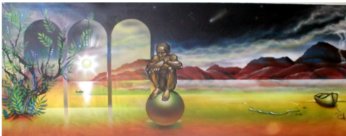
Рис. 10. Творча робота А.Г. Шаповала за напрямом – живопис, «Комета Хейла-Боппа», акрил, картон, 1997 р.

Чорно-білі роботи художника глибоко реалістичні, не містять в собі зайвих деталей, але в той же час на них детально і правдиво прорисовуються всі дрібниці. Цей вид мистецтва вимагає від художника і таланту, і вміння користуватись