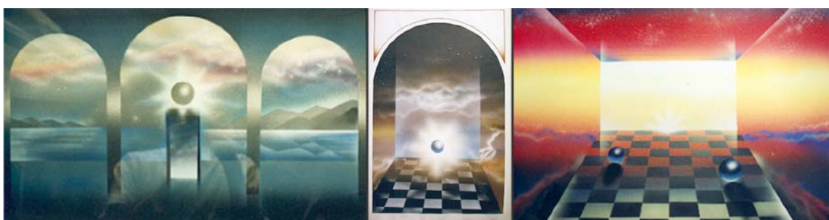
Рис. 4. Творчі роботи А.Г. Шаповала за напрямом – аерографія на екологічну тему, темпера, 2000 р.

Метафорично-стилізовані елементи авторських робіт життєвої або фантастичної теми доречно розмістити, наприклад, на палантинах, шарфах і хустках великих розмірів та інших виробках обраного асортименту.