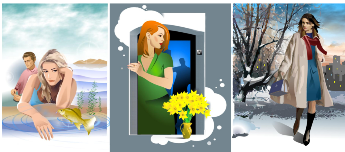
Рис. 5. Творчі роботи А.Г. Шаповала за напрямом – ілюстрації, комп'ютерна графіка, 2006 р.

увагу і підсилити психоемоційний вплив на глядача. Така висока техніка та професіоналізм дозволяють художнику в кожному образі передати відчуття даної людини, змушують глядача задуматись і пропустити їх думки крізь себе. (рис. 5). Хустково-шарфові вироби мають відповідати художній концепції одягу, сформованому суспільному естетичному ідеалу, новизні моделі і конструкції, ступеню досконалості композиції моделі.