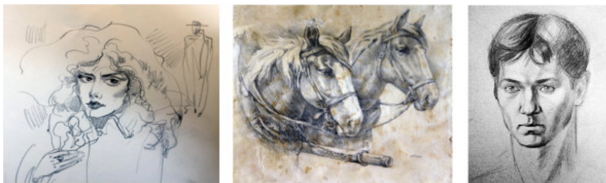
Рис. 11. Творчі роботи А.Г. Шаповала за напрямом – графіка, «Маргарита», «Коні», «Портрет сучасника», олівець, 1983-89 рр.

єдиним реквізитом, як би граючи світлом і тінню (рис. 11). Тематичними можуть бути хустково-шарфові вироби з рисунком, що демонструють культуру, вишуканий смак, соціальний статус, шанування традицій тощо.