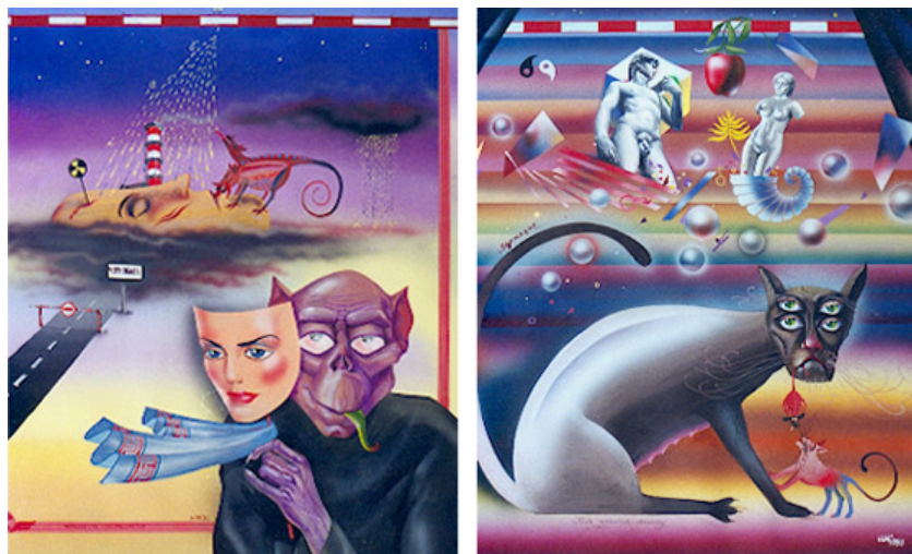
Рис. 2. Творчі роботи А.Г. Шаповала за напрямом – живопис на екологічну тему, диптих, присвячений трагедії на Чорнобильській АЕС, «Радіація», «Мутація», темпера, 1987 р.

Образи живопису художника-ілюстратора Шаповала А.Г. дуже наочні й переконливі, відрізняються специфікою технічного виконання і незвичайним рішенням художньо-образних завдань. Так, представлений диптих виконано з використанням ахроматичної колірної гами і присвячено трагедії на Чорнобильській АЕС (рис. 2).