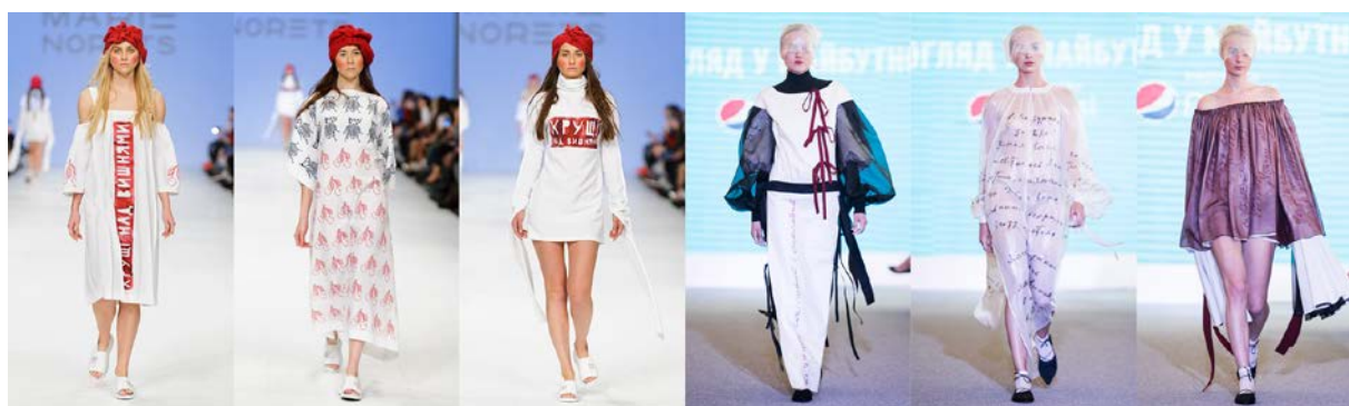
Рис 5. Показ моделей з розробленої колекції у фіналі конкурсів «EPSON DIGITAL FASHION» та «Погляд у майбутнє»