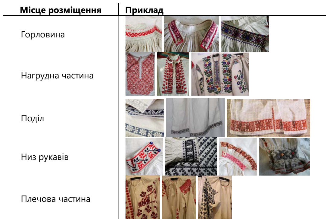
Таблиця 1. Варіанти розміщення орнаменталістики на сорочках

Застосування принципів крою українських сорочок у проектуванні актуальної колекції молодіжного жіночого одягу можна розглядати як продовження тенденції звернення до архаїчного крою одягу різних цивілізацій. Дана тенденція спостерігається у сучасних колекціях багатьох світових брендів.