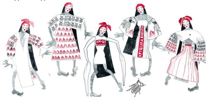
Рис 4. Пропозиції творчо-образного ескізного рішення обраного асортиментного блоку колекції, спроектованої за темою творчого джерела

На рис. 5 наведені фото моделей з різних асортиментних блоків колекції.