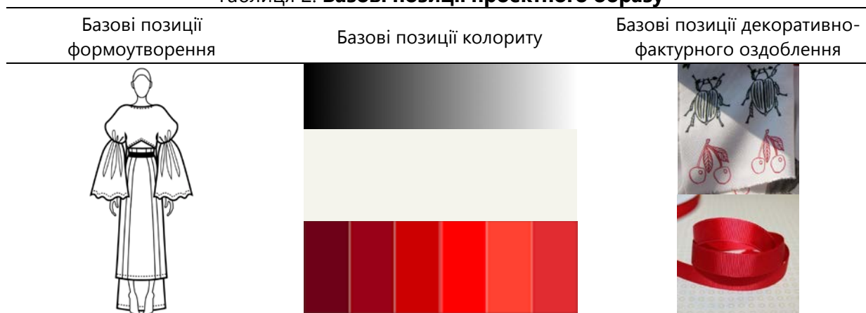
Таблиця 2. Базові позиції проектного образу