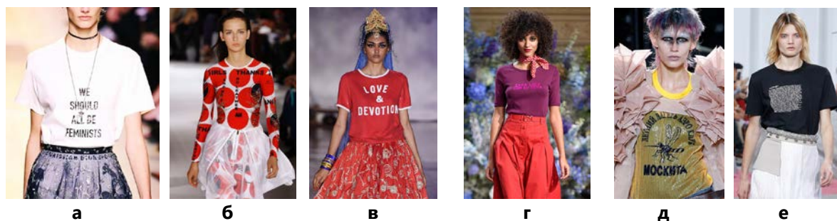
Рис. 2. Приклади використання текстового друку:

Серед таких рішень у декоративному оздобленні одягу дедалі більшої популярності набуває текстовий друк. Футболка, що є своєрідною осучасненою інтерпретацією натільної сорочки, частіше за інші предмети одягу стає полотном для художників і трибуною для висловлювань. Марія Грація Кьюрі дебютувала в Dior з гучними закликами до революції і загального фемінізму. Стелла Маккартні – відома захисниця природи, наприклад, продовжує лобювати «зелену» тему. Ашиш Гупта, судячи з принтів, більше стурбований питаннями міграції, любові і відданості. Ванесса Сьюард друкує на футболках філософські фрази з повсякденного життя. Юнія Ватанабе надрукував на футболках кириличні написи. Carven інтригують кількістю тексту: на їхніх футболках надруковані цілі опуси (рис.2) [10].