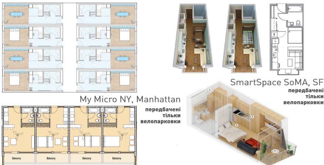
Рис. 1. Малометражне житло, США

одноосібних домогосподарств. Наприклад, реалізовані проекти таких квартир у США, Канаді, Китаї, Німеччині (рис. 1).