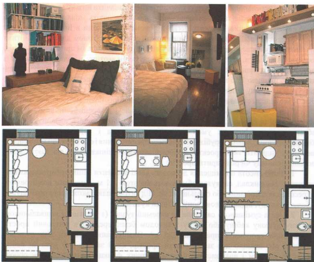
Рис. 3. Квартира загальною площею 19,5 м 2 (арх. К. Паттерсон, Нью-Йорк). Плани, інтер'єри

У даному дослідженні запропоновано три проектних пропозицій планувальних рішень однокімнатних квартир (1К1, 1К4, 1К10), що мають таку загальну площу: 18,10 м 2 , 20,87 м 2 , 29,28 м 2 (рис. 4).