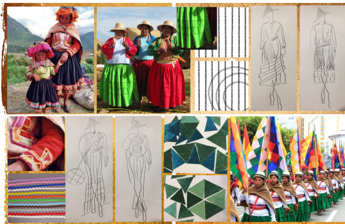
Рис. 3. Трансформація творчого джерела

Важливим моментом при розробці одягу є визначення його призначення і асортименту [8]. Колекція повинна бути функціональною, практичною та адаптованою до різних сфер використання. Вона має містити широкий асортимент виробів, які легко комбінуються між собою та є взаємозамінними, що дасть змогу підібрати одяг для роботи в офісі, відвідування ділових зустрічей, дозвілля або повсякденного носіння. Тому, з метою створення цілісного сприйняття колекції одягу використано гармонійні за кольором та фактурою матеріали. Оскільки проектується діловий одяг, перевагу надано коричневій палітрі в поєднанні з зеленим та синім. Серед асортименту тканин обрано платтяну штапельну тканину та еластичну сітчасту тканину для суконь, костюмну тканину для штанів, трикотаж та оксамит для светрів, плащову тканину для плаща та куртки. Для розробки колекції жіночого одягу використано комбінаторний метод проектування, в основі якого лежить