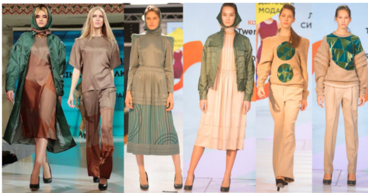
Рис. 6. Фото колекції «Twenty-nine»

«Twenty-nine» (рис. 6), яку представлено на конкурсах молодих дизайнерів. В міжнародному конкурсі молодих дизайнерів «Печерські каштани» (м. Київ, КНУТД, 2017 р.) отримано диплом третього ступеня в номінації Прет-а-порте. У конкурсі молодих дизайнерів «New Fashion Zone» (м. Київ, NFZ community, 2017 р.) здобуто перше місце в номінації «Ділова мода». В міжнародному конкурсі дизайнерів «Мода без кордонів» (м. Кропивницький, МА «Mix models», 2017 р.) отримано диплом другого ступеня за участь в номінації прет-а-порте. Фото готових моделей авторської колекції «Twenty-nine» представлено на рис. 6.