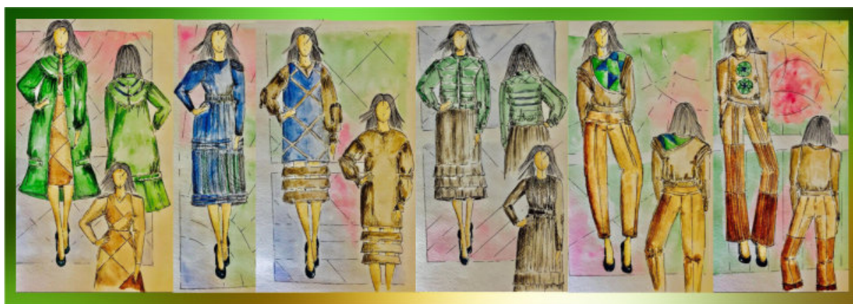
Рис. 4. Ескізи колекції жіночого одягу з використанням техніки печворк

В процесі творчої діяльності не завжди чітко сплановано застосування конкретних методів проектування, адже процес творчості є складний, багатовекторний та інколи суперечливий. Тому в ході роботи, орієнтуючись на поставлені цілі, завдання, на основі дослідження, виділено три основних методи виготовлення одягу з використанням техніки печворк (рис. 5).