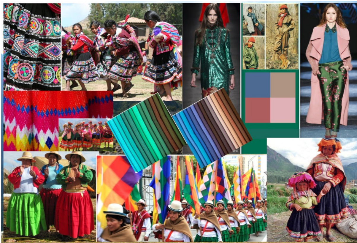
Рис. 1. Колаж джерела натхнення для розробки колекції

Головним етапом при створенні колекції є визначення творчої концепції, що несе в собі емоційну складову костюма та певний естетичний характер. Її суть впливає на цілісність художнього образу та його гармонійне сприйняття. Джерелом натхнення для дизайн-проектування колекції жіночого одягу став перуанський національний костюм, окремі ознаки якого були використані при проектуванні виробів (рис.1).