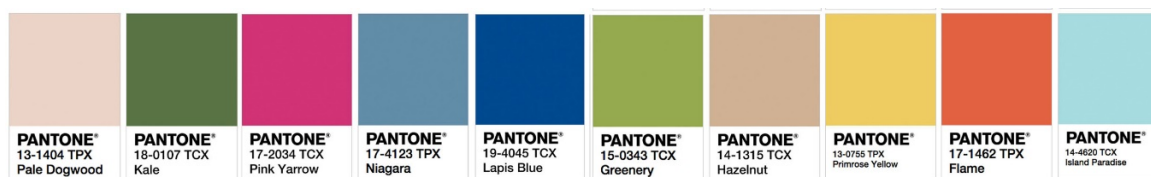
Рис. 2. Актуальні кольори 2017 року за визначенням PANTONE

Список трендових кольорів складається з десяти кольорів: рожевий деревій, кучерява капуста, рожевий пурпур, ніагара, синій ляпіс, свіжа зелень, лісовий горіх, блідо-жовтий, полум'я, острівний рай (рис. 2) [6].