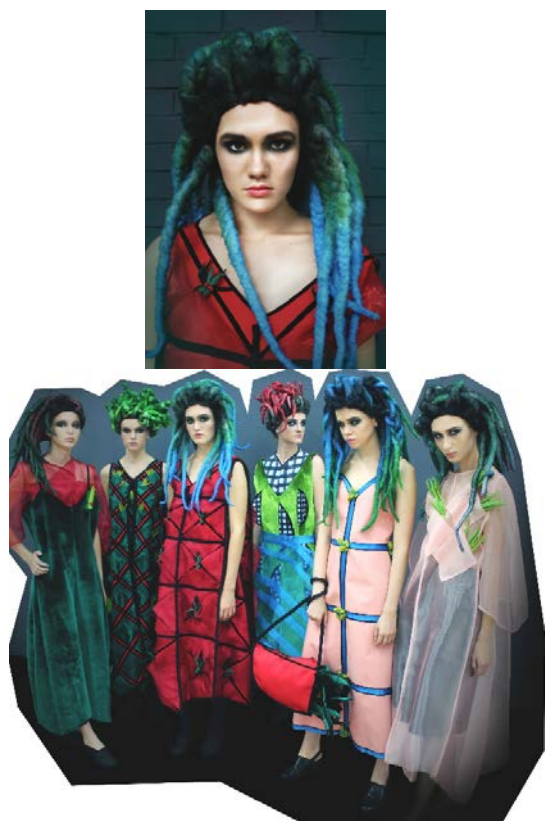
Рис. 5. Моделі блоку арт-костюма колекції жіночого одягу

Висновки. Аналітичні дослідження екологічної архітектури світу дозволили визначити основні художньо-композиційні ознаки для вдосконалення проектування перспективної колекції жіночого одягу. Виконано класифікацію світової екологічної архітектури; проведено системно-структурний аналіз еко-архітектурних форм з визначенням можливостей застосування її принципів та художньо-композиційних