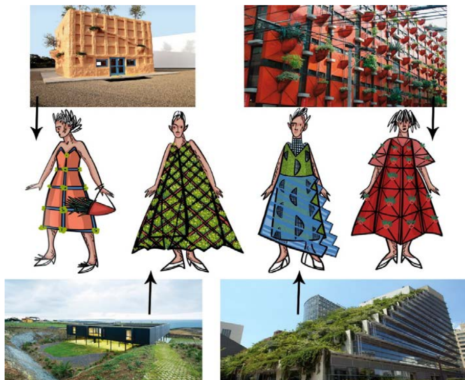
Рис. 4. Відповідність моделей одягу еко-архітектурним прототипам

суспільної ролі споживачів з метою створення індивідуальних образів відповідно конкретних ситуацій. Це обумовлено тим, що в реальних умовах життєдіяльності кожен споживач формує власний гардероб самостійно, виходячи з естетичних та фінансових можливостей.