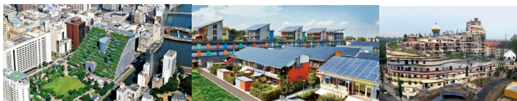
Архітектурні еко-комплекси або еко-поселення