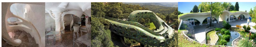
Повне злиття архітектури та природи