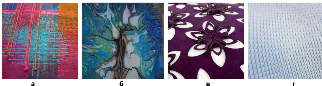
Рис. 4. Приклади фактур машинного способу виготовлення: а – ткацтво; б – мармурування; в – перфорація; г – гофрування [9]

Поширеним є автоматизоване виготовлення фактурних ефектів для одягу, аксесуарів, іграшок та інших виробів. Але деякі способи створення фактур мають обмежений діапазон застосування. Наприклад, штучне зістарювання найчастіше використовують для виготовлення виробів декоративного призначення. Така техніка не застосовується для повсякденного одягу за виключенням джинсового, оскільки в процесі витирання, знебарвлення та штопання навмисно