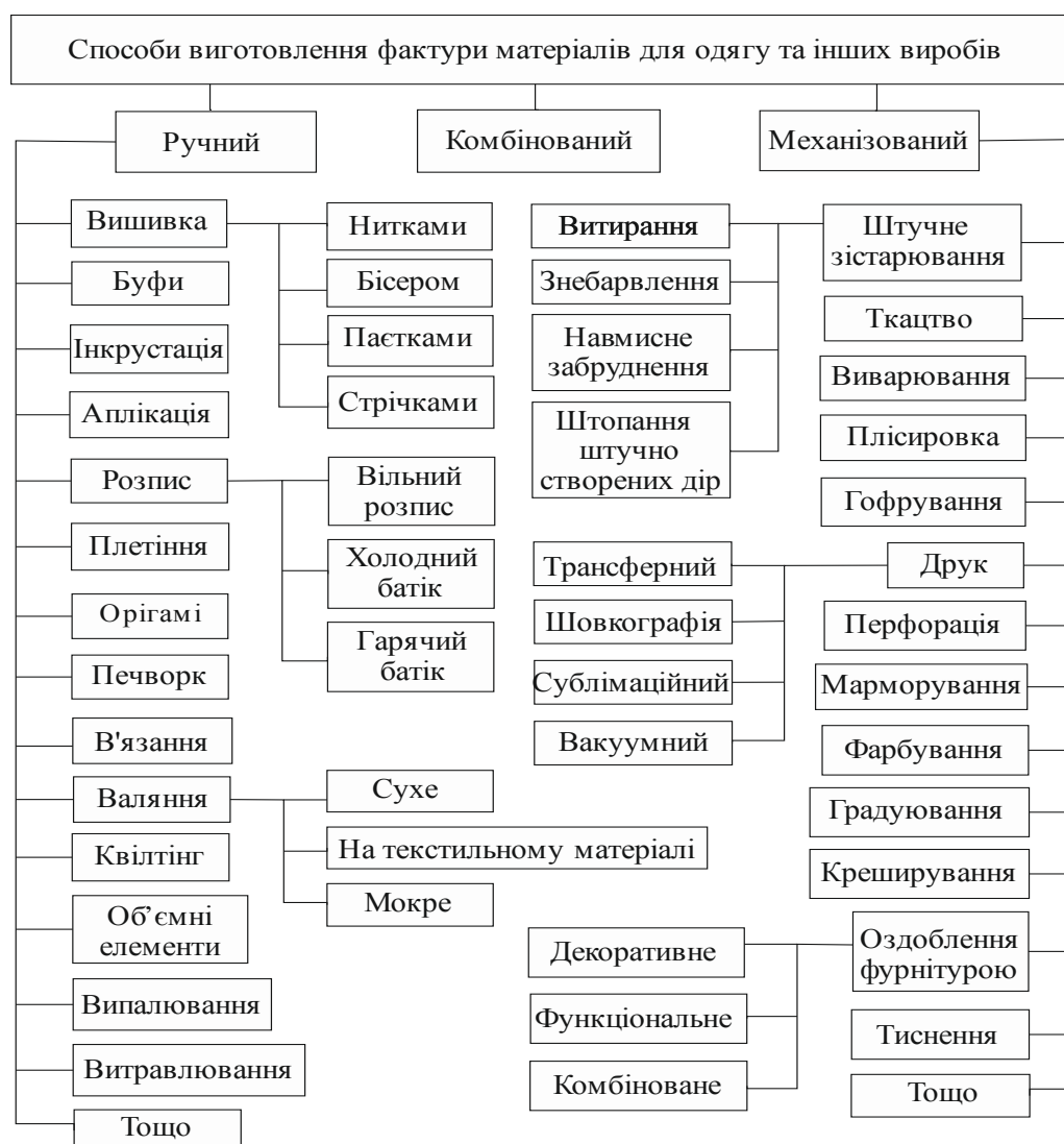
Рис. 2. Систематизація способів виробництва фактури матеріалів для одягу та інших виробів

відсутності обґрунтованої потреби фактури може відбуватися автоматизованим способом.