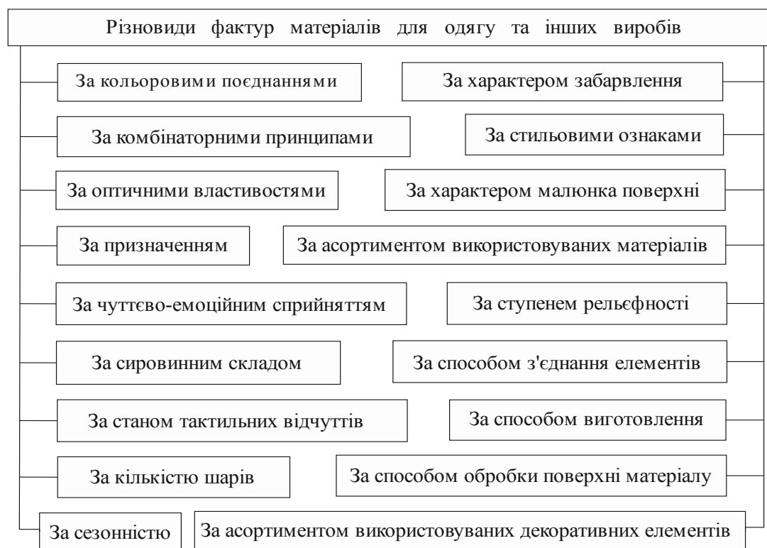
Рис. 1. Класифікація різновидів фактур матеріалів для одягу та інших виробів

Штучні фактури отримують шляхом технологічної обробки поверхні, у процесі якої відбувається зміна первинного матеріалу та надання йому нових візуально-пластичних якостей. Наприклад, застосування різноманітних способів обробки натуральної шкіри та хутра з метою покращення естетичних, ергономічних, функціональних тощо характеристик виробів з них.