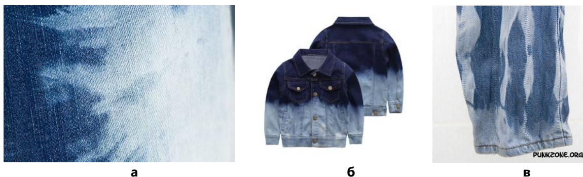
Рис. 5. Приклади застосування техніки знебарвлення джинсового одягу: а – хаотичними плямами; б – градієнтне; в – вертикальними смужками [7]