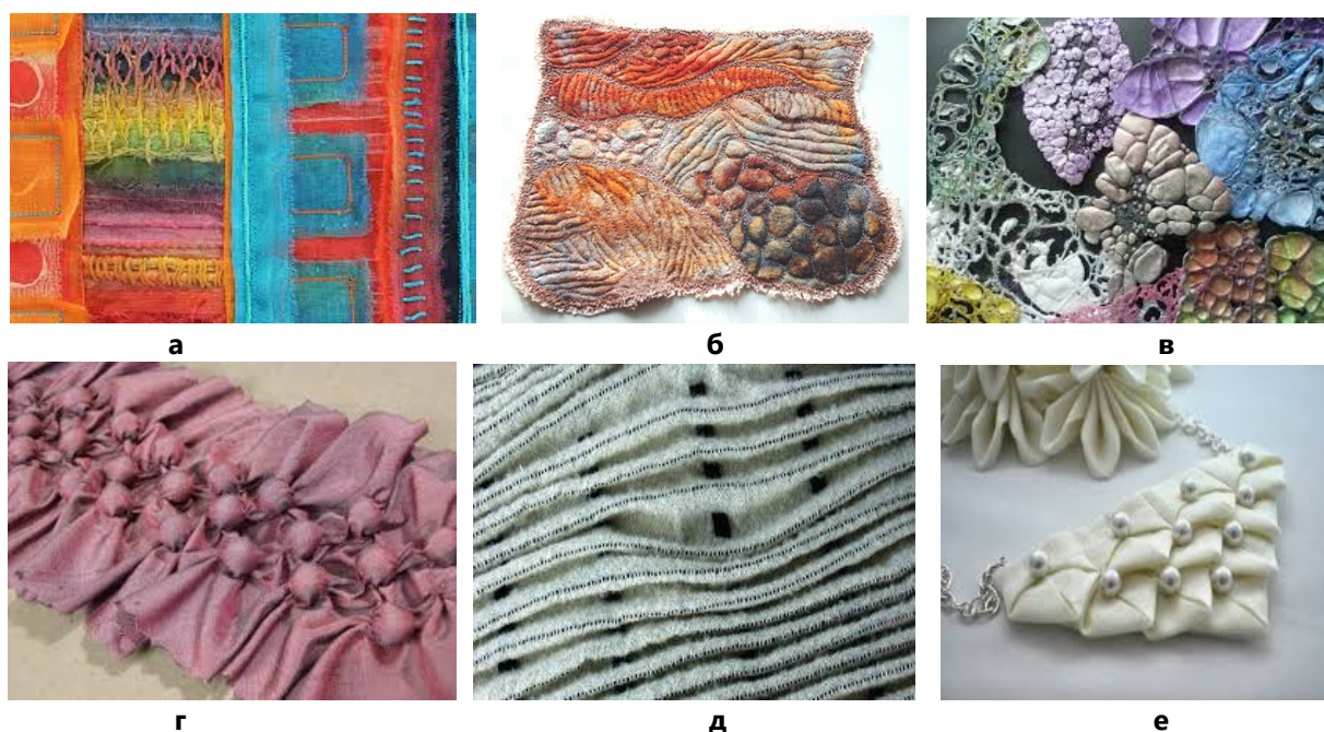
Рис. 3. Приклади фактур ручного способу виготовлення: а – аплікація; б – мокре валяння; в – випалювання; г – використання об'ємних елементів; д – буфи; е – техніка оригамі [5,6]